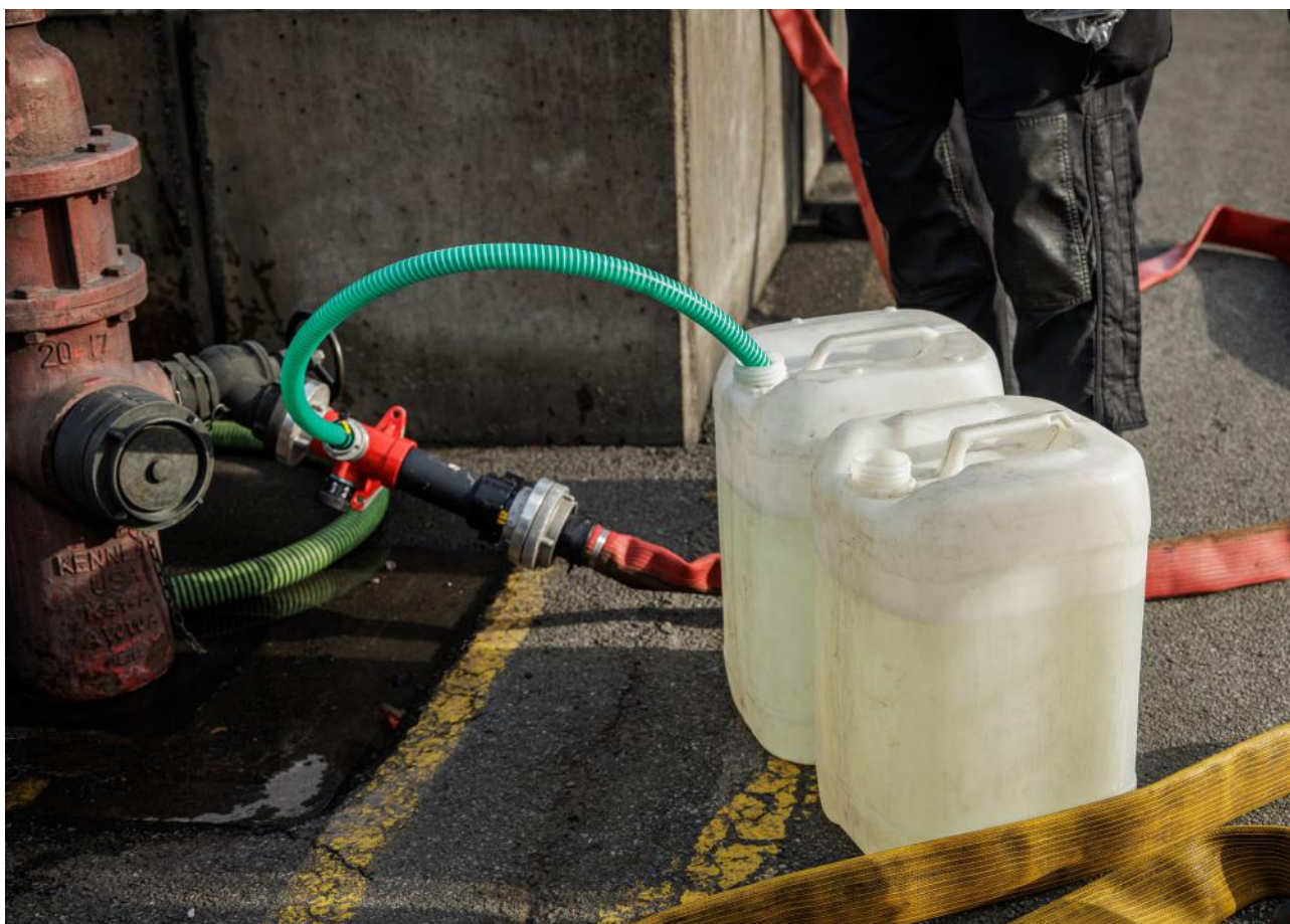
Zumischung von Schaummittel

Die als gefährlich eingestuftes Löschschäume werden regulär in einer Hochtemperatur-Verbrennungsanlage (Sonderabfallverbrennungsanlage) entsorgt, die über eine Zulassung für diese Abfallschlüsselnummer verfügt. Für die Entsorgung sollten sich Abfallerzeuger oder -besitzer an ein entsprechendes Entsorgungsunternehmen wenden.