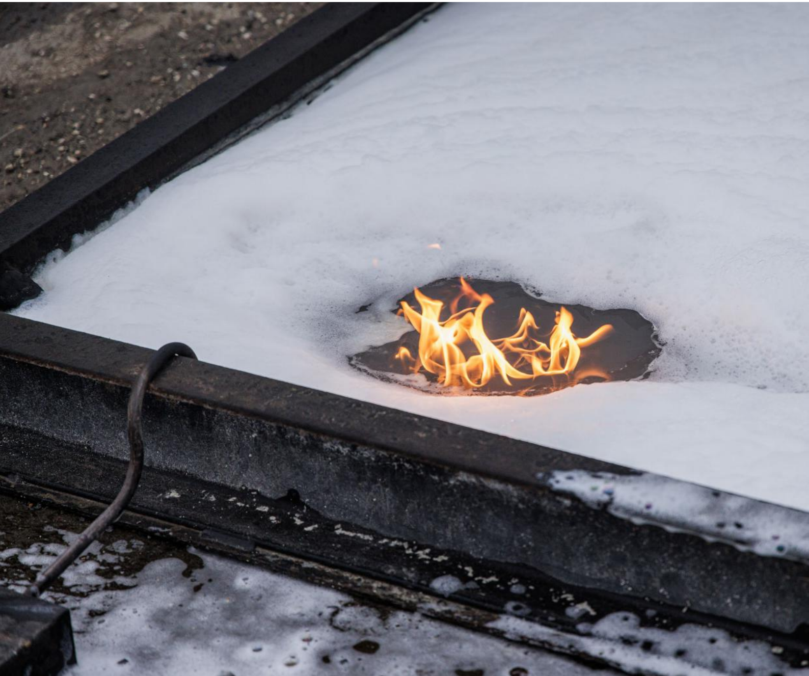
Schaum löscht einen Flüssigkeitsbrand